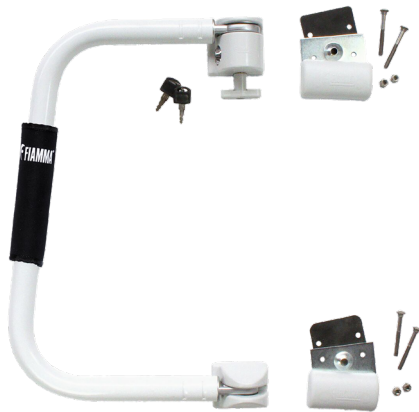
Art-Nr. 250/523 Hersteller-Nr. 03513A01-