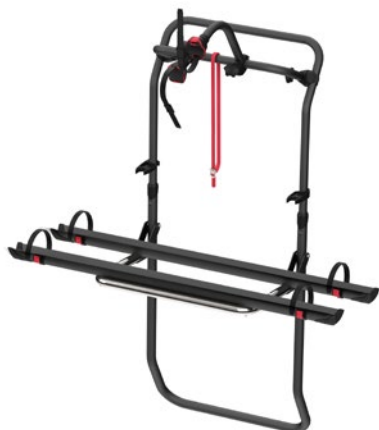
Art-Nr. 136/270 Hersteller-Nr. 02096-35A