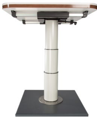
Art-Nr. 250/246 Hersteller-Nr. 5988 G06V