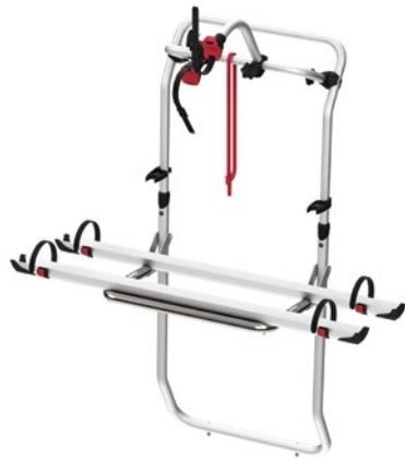
Art-Nr. 136/269 Hersteller-Nr. 02096-35-