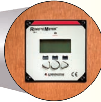
Befestigung in der Wand