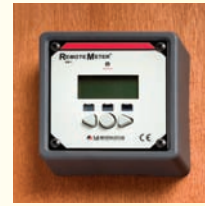
Befestigung mittels Halterung