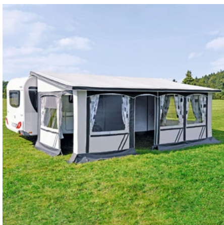
Art-Nr. 075/139 Hersteller-Nr. z00930_600/FF