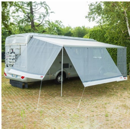
Art-Nr. 071/471 Hersteller-Nr. 08185A01-