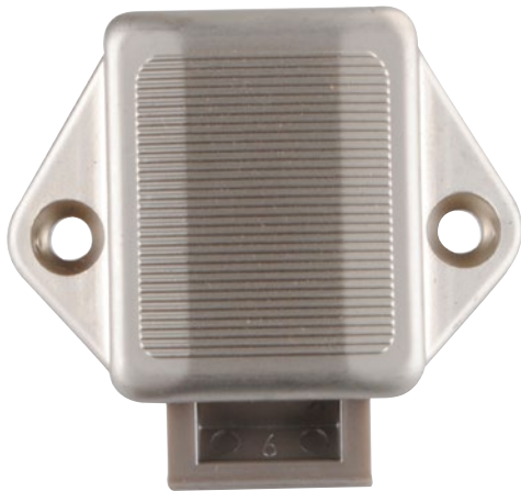
Art-Nr. 250/506 Hersteller-Nr. 211.61.604