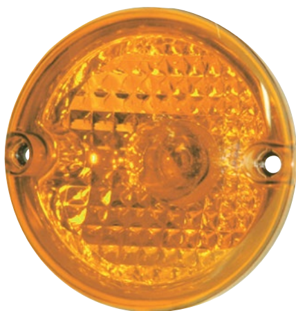
Art-Nr. 140/175 Hersteller-Nr. 131.019.500