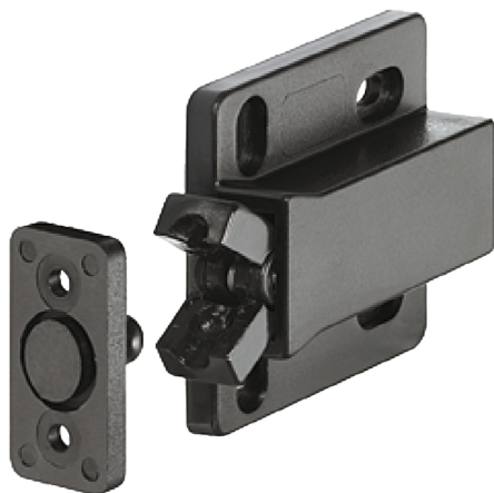
Art-Nr. 250/443 Hersteller-Nr. 250/443-1