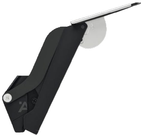
Art-Nr. 250/453 Hersteller-Nr. 372.27.300